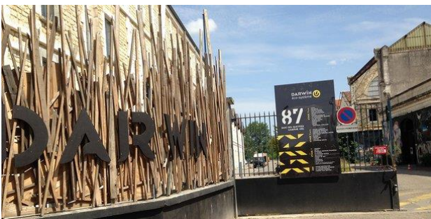
Entrée de Darwin

Darwin fut construit en 1840 par la compagnie anonyme des magasins généraux afin de stocker des marchandises qui arrivaient par la Garonne ou par train. Malheureusement ce lieu fit faillite en 1870 et l'Etat racheta ce lieu. Jusqu'aux années 2000 Darwin faisait office de caserne militaire mais fut vendu lorsque Jacques Chirac supprima l'obligation du service militaire. Jusqu'en 2006 l'endroit complètement délaissé était destiné à être détruit... Toutefois lors de la commission pour élire Bordeaux en tant que capital de la culture européenne, Darwin a eu un second souffle grâce à Alain Juppé.