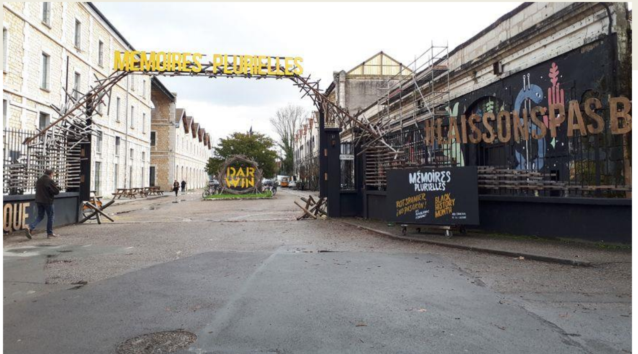
Une arche en guise d'accueil afin de rappeler l'histoire de ce lieu