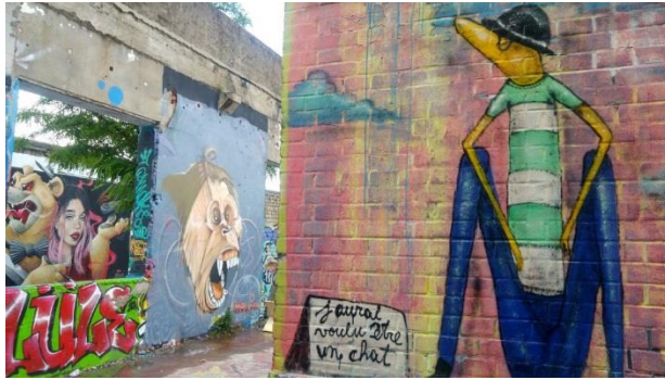
Type de graffitis à Darwin

Nous avons également aimé la modernité de ce lieu avec l'arbre qui traverse les murs de Darwin et qui permet de passer d'un bâtiment à l'autre. C'est original.