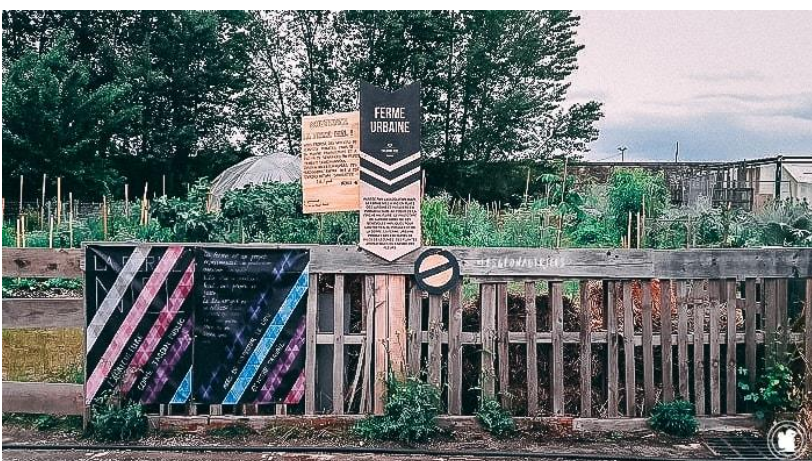
Ferme de Darwin

Lors de cette visite, nous avons appris beaucoup de chose sur Darwin telles que la présence de nombreuses associations et d'espaces de co-working. La présence d'un lycée qui nous a vraiment marqué et intrigué car Darwin est un lieu pour nous à la base pour sortir, se décontracter et trainer avec ses amies et donc de voir un lycée dans ce cadre n'est pas forcément commun. Nous avons des termes ou approfondi certaines notions comme celles du « co-working » ou encore « d'écosystème ». Nous avons également appris l'histoire de cet endroit, puisque nous venions dans cet endroit auparavant sans la connaître.