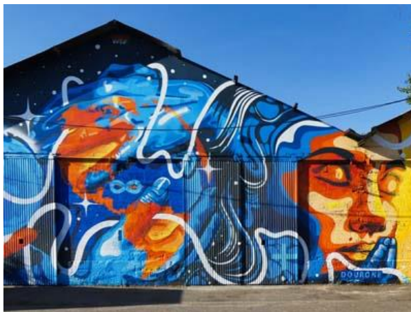
Type de graffitis à Darwin