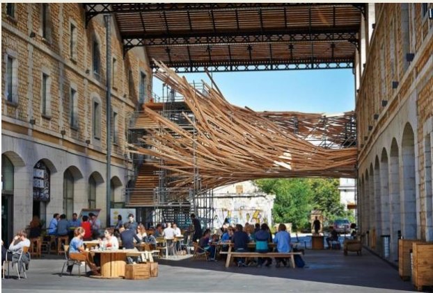
Darwin de l'intérieur