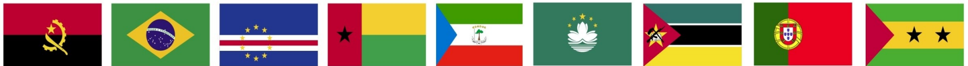
Angola Brasil Cabo Verde Guiné-Bissau Guiné-Equatorial Macau Moçambique Portugal São Tomé e Príncipe